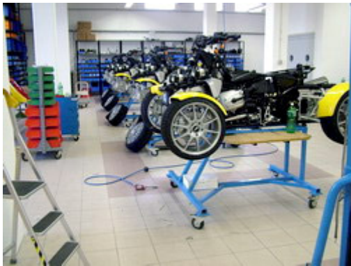
Kleinserienfertigung mit höchster Qualität