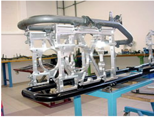
Rahmenteile und Trägerplattenmontage.