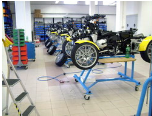
Kapazität zur Zeit: 6 GG-Quad pro Monat