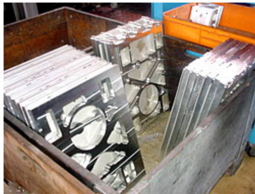
Trägerplatten roh vorgearbeitet