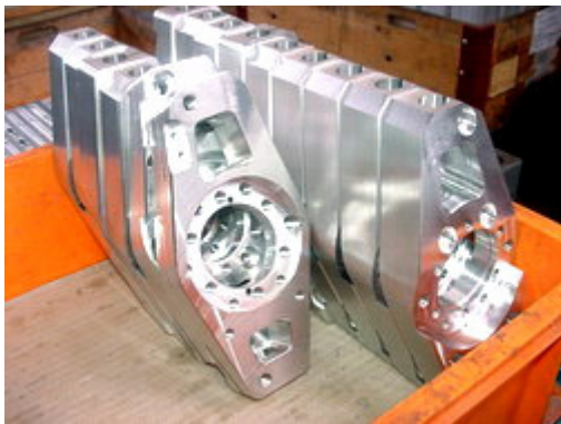
Radträger vor dem Finish